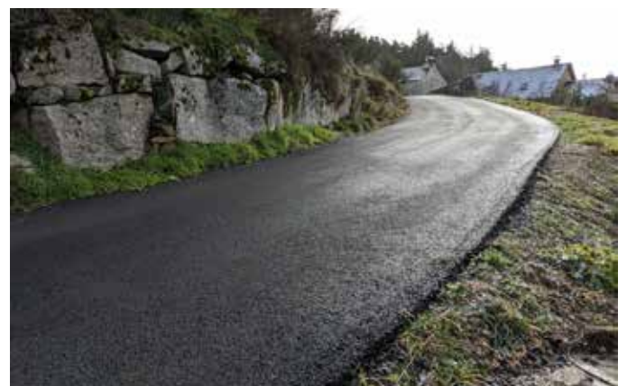
Programme voirie Javols : Le Régimbal, Volpillac et le Mas Neuf