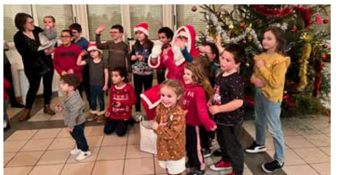
Le Père Noël à l'école de Sainte Colombe !

Pour beaucoup d'entre eux, c'était une première, un voyage qu'ils n'oublieront pas de sitôt !