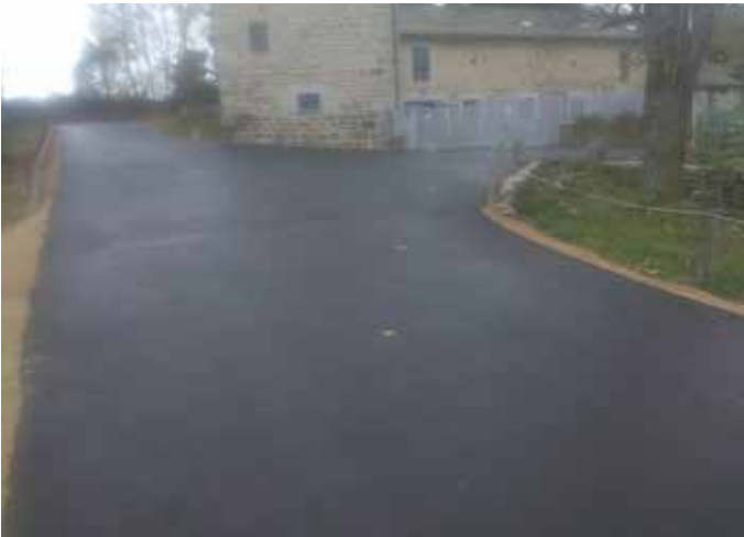
Travaux voirie - enfouissement réseaux secs au Ventouzet