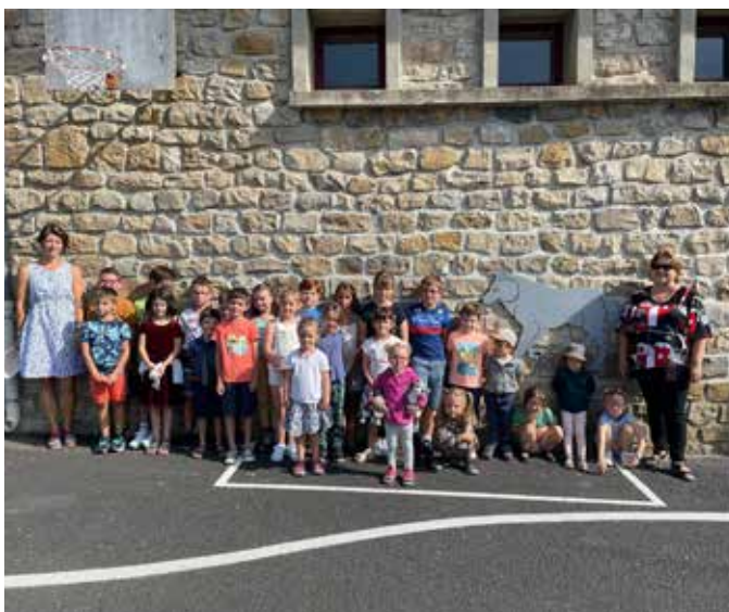
Rentrée à l'école publique de St Sauveur