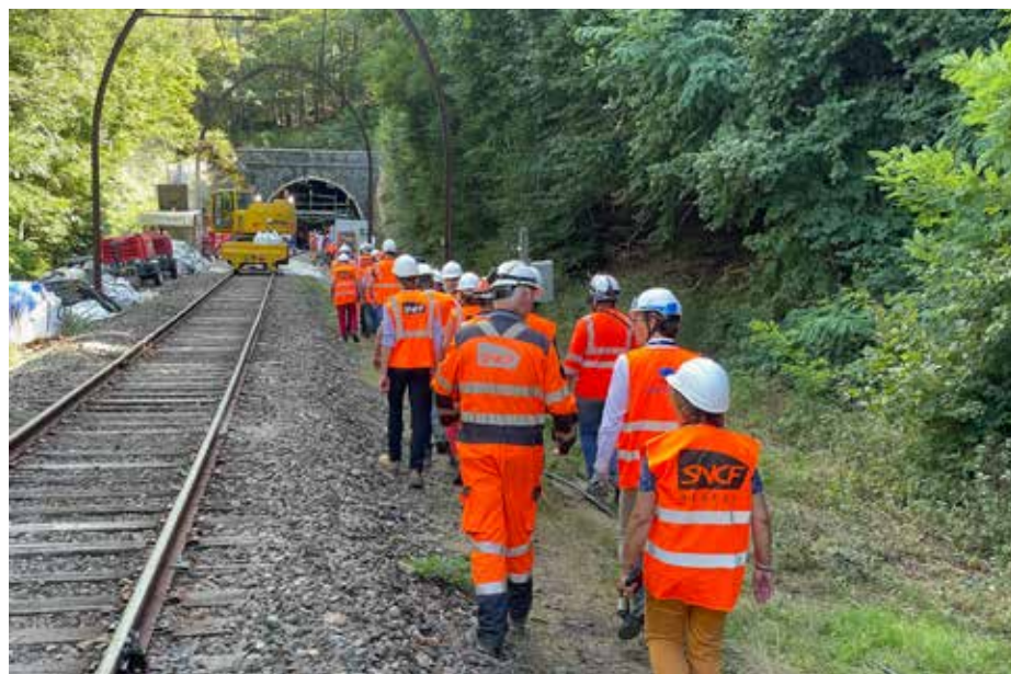
Visite tunnel de Grifoulière à St Sauveur