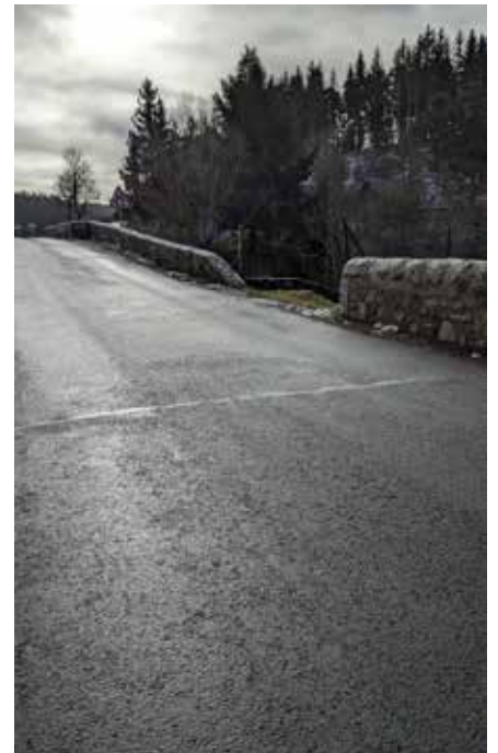
Travaux voirie RD Javols