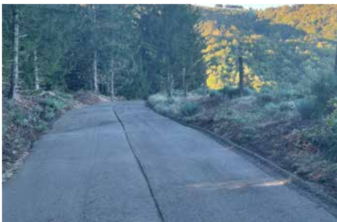
Rénovation chemin Chapchiniès