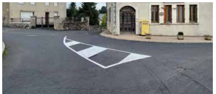
Signalisation horizontale St Sauveur