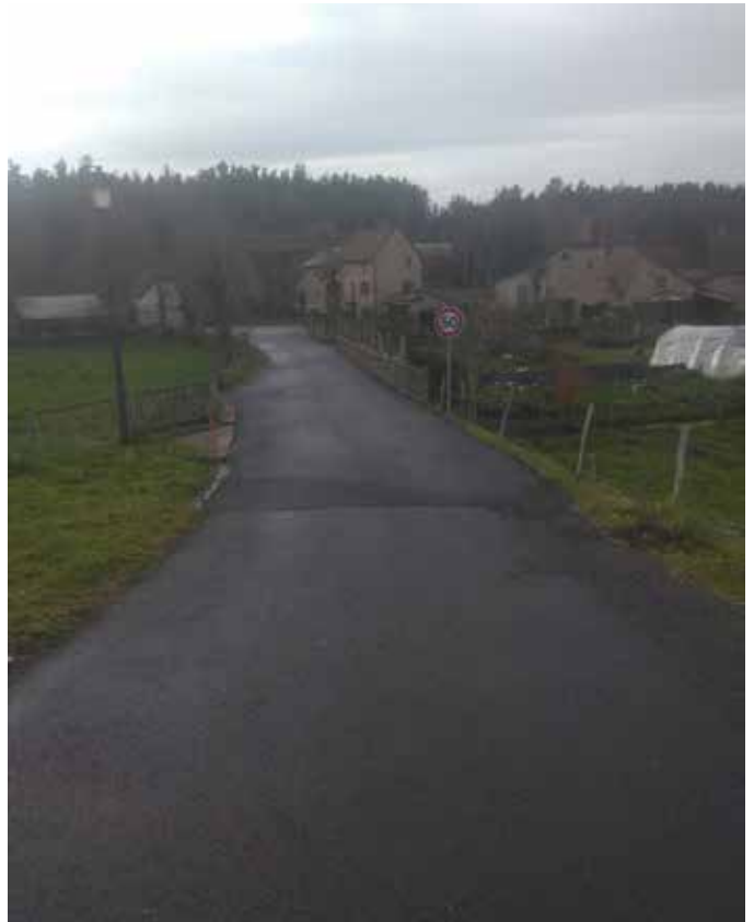
Travaux programme voirie à Couffinet