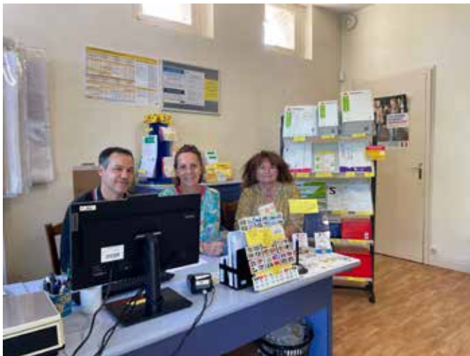
APC provisoire à St Sauveur