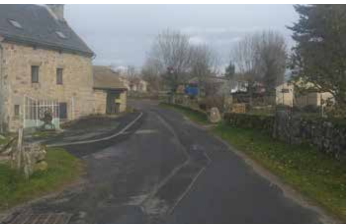
Travaux voirie au Cher

Destinés aux enfants de 2 à 12 ans, ces équipements représentent un joli complément d'activités au terrain de hand-basket-volley; Ils profiteront à tous et notamment aux enfants de l'école Léon Dalle.