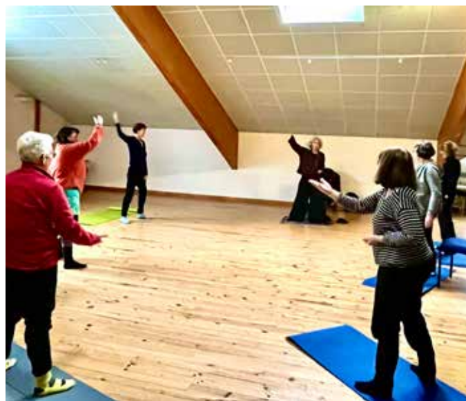
Atelier Qi Gong