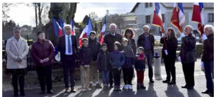
Cérémonie du 11 novembre à St Sauveur