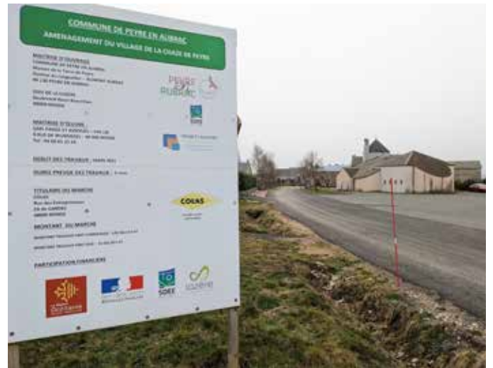
Aménagement La Chaze de Peyre