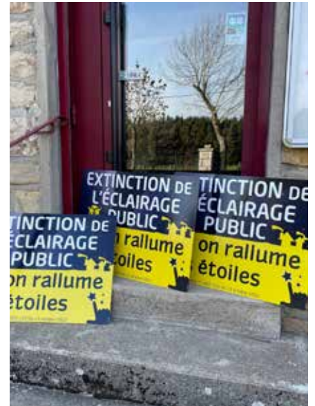
Extinction de l'éclairage public à St Sauveur