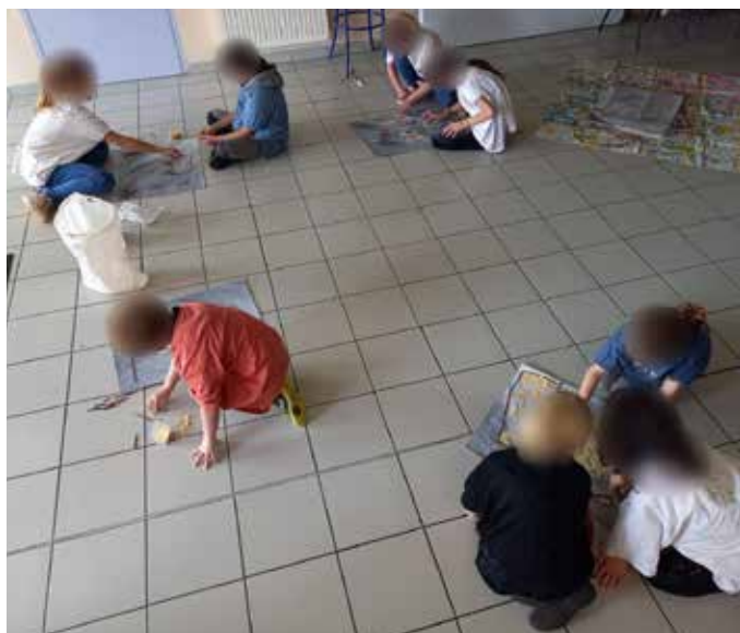
Atelier arts plastiques « Les sansonnets »