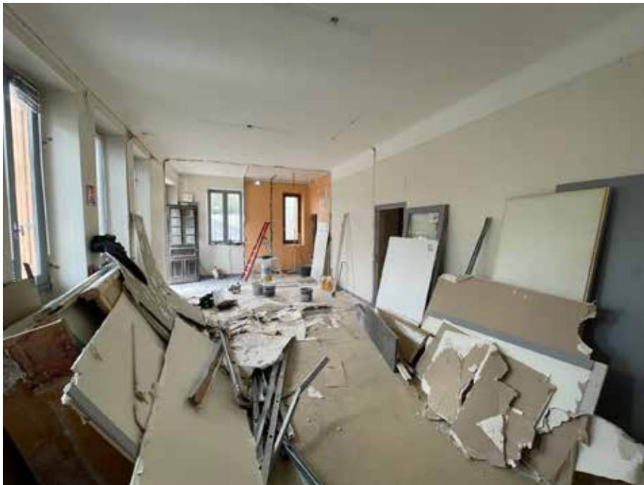
Travaux Agence Postale à St Sauveur