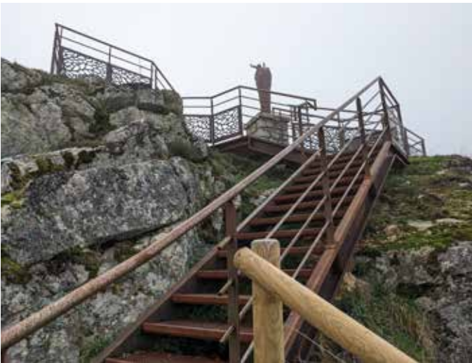
Aménagement Roc du Cher