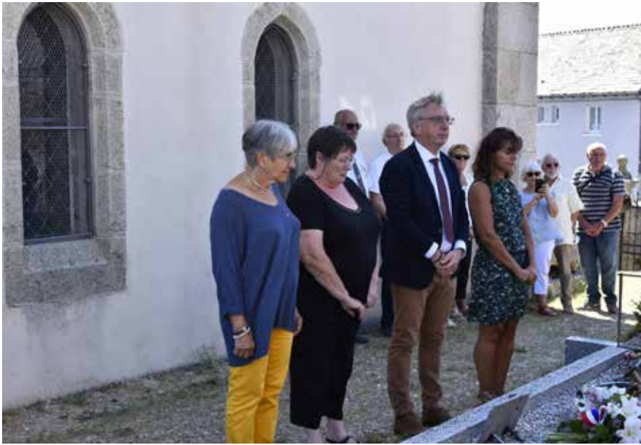
Cérémonie 11 août 2022 à St Sauveur