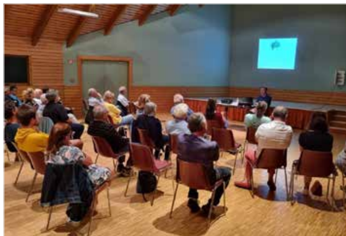
Soirée langues régionales à St Sauveur de Peyre le 29 août