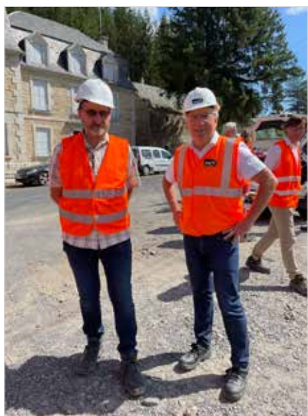
Visite tunnel de Grifoulière à St Sauveur