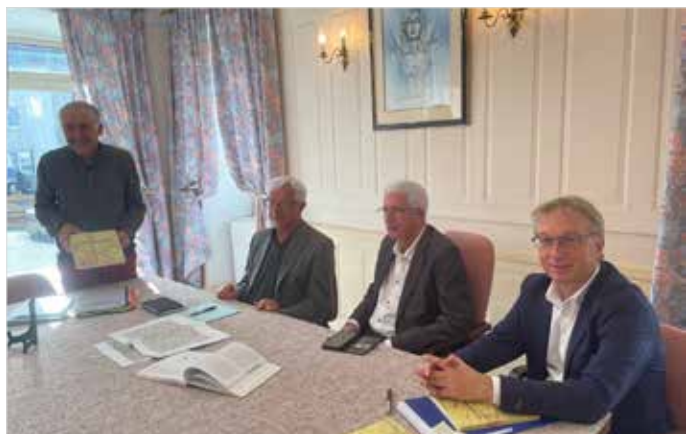
Présentation du livre «Les Seigneurs de Peyre» à Aumont-Aubrac