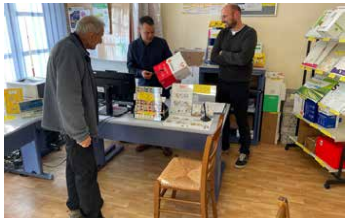
Mutualisation remplacement pour les APC de St Sauveur et Javols