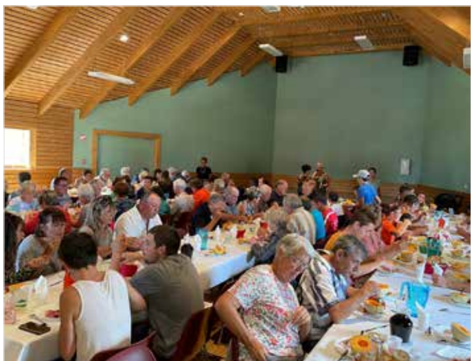
Repas pour la fête à St Sauveur de Peyre le 21 août