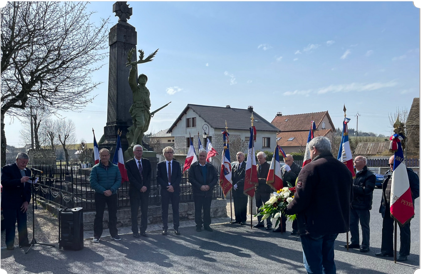
Commémoration du 19 mars 1962