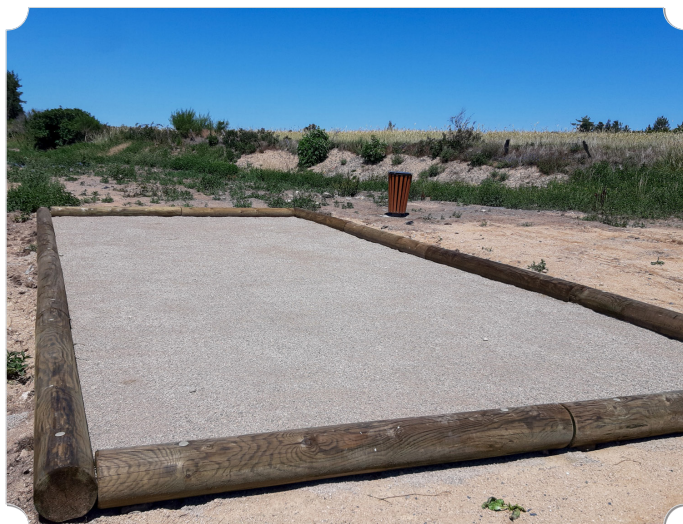
Bancs et terrain de pétanque à La Chaze