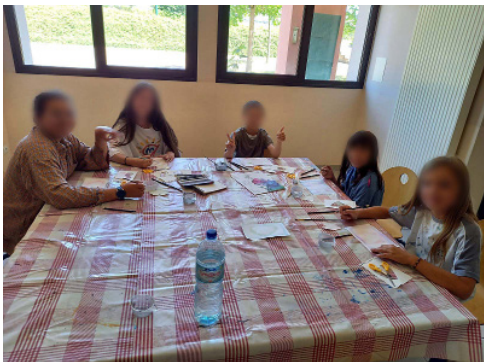
Atelier des sansonnets

Les nombreux ateliers réguliers du Foyer Rural se sont arrêtés avec la fin de l'année scolaire. Toutes ces activités ont manifestement plu au public : le Foyer Rural compte cette année près de 330 adhérents, malgré un contexte sanitaire compliqué qui a conduit notamment à l'annulation du stage de ski cet hiver.